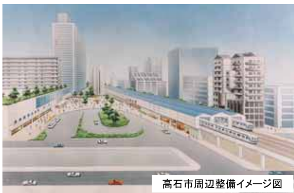
高石市周辺整備イメージ図