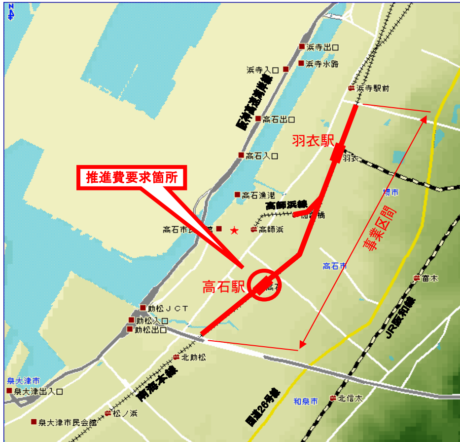
高石駅付近完成イメージ