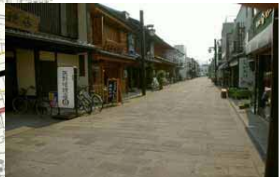
石畳舗装・電線類の地中化による道路の美装化