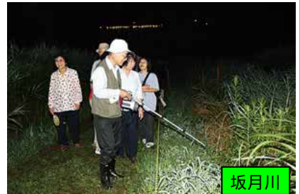
愛好会によるホタル鑑賞会(H17)