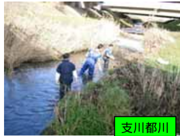
住民による清掃活動(H17)