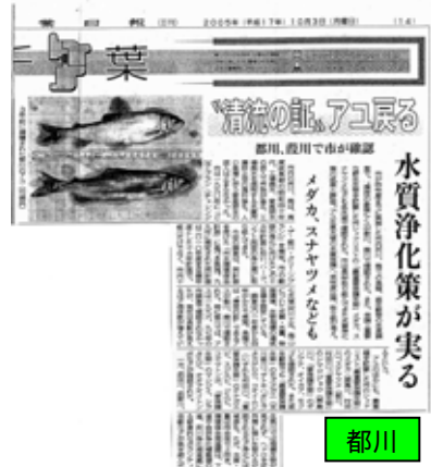
平成13年に鮎の遡上を確認