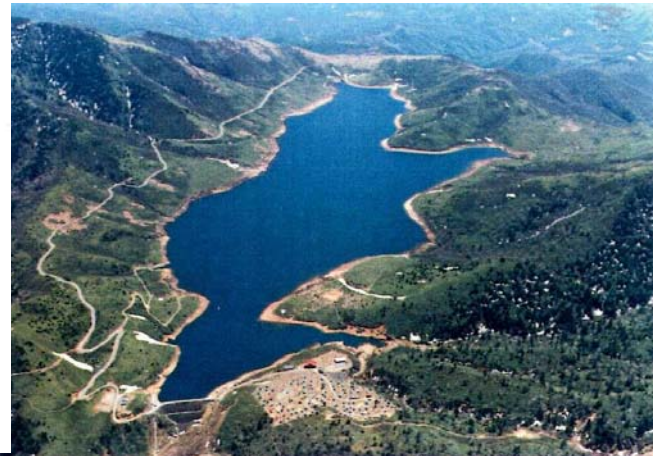
野反ダム貯水池全景