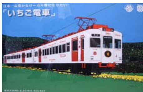
シンボル車両「いちご電車」

運営していた鉄道事業者により廃止の届出が出された貴志川線について、地元住民が熱心な存続活動を行い、これを受けた地元自治体が新たな事業者が参入しうる支援策を打ち出し、一般公募を実施した。この公募に応じた県外の鉄道事業者は、地元で根ざした事業運営を目指し運行を引き継いだ。地方鉄道の再チャレンジのためモデルとなる取り組みである。