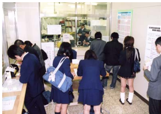
買い求める学生たち