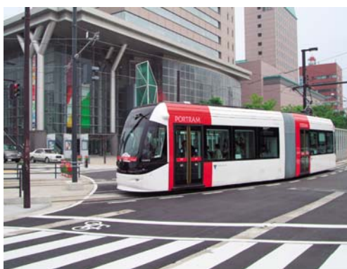
街の中を走るポートラム

我が国初の本格的なシステムとしてのLRTの導入事例である。地元自治体によるまちづくり構想の中で公共交通のあり方を明確に位置づけており、フィーダーバスの運行をはじめ、周辺地域と一体となった整備を進めている。さらに、基金の設置をはじめとした住民参加を促進する仕組みも併せて整備されている。今後の地方都市圏におけるLRT整備のあり方の代表事例となりうる取り組みである。