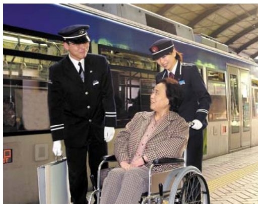
サービス介助士資格を有した職員

世田谷線において、ハード・ソフトの両面から、全ての人に快適で利用しやすい鉄道サービスを提供している事例である。車両の更新や停留所の改良、ICカードの導入等のハード面のみならず、同線の乗務員・案内係全員がサービス介助士資格を取得する等、更に進んだサービスの提供に努めている。