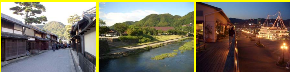
良好な景観形成に資する公共事業の実施

公共事業における景観形成の波及効果把握手法検討調査 →景観の形成により現れる波及効果の測定・把握手法確立