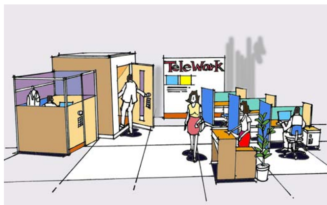
テレワークセンター イメージ図