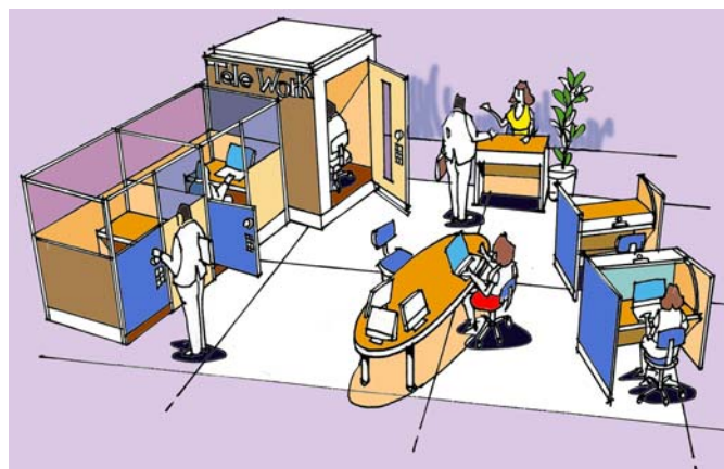
テレワークセンター イメージ図

下記URLにて座席予約をすることができます。 URL： http://www.t-work.jp