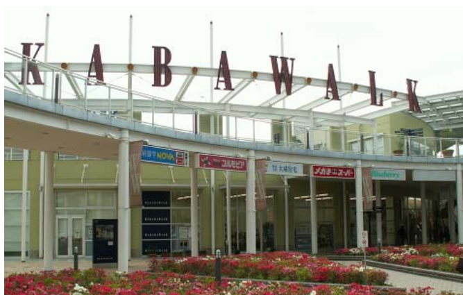
鶴ヶ島市市民活動推進センター

鶴ヶ島市市民活動推進センターは、市民活動の情報発信の拠点として様々な情報の提供、市民活動に関する相談、打ち合わせや交流の場を提供しています。