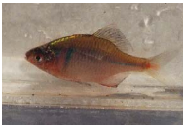
ニッポンバラタナゴ

今回の調査では、アユモドキ、ニッポンバラタナゴ（魚類）、ヒシモドキ、キタミソウ（植物）、クロツラヘラサギ、コシャクシギ（鳥類）など 254 種が確認されました。これら絶滅危惧種の生息・生育状況の把握をするためにも、今後も河川水辺の国勢調査により継続的に調査を続けていくことが必要です。