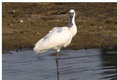
クロツラヘラサギ