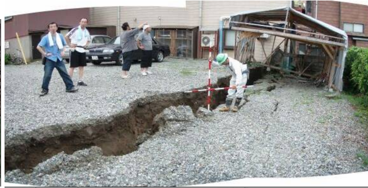
かしわぎし にしみなとちょう 新潟県 柏崎市 西港町