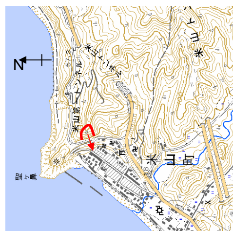
新潟県柏崎市 米山町