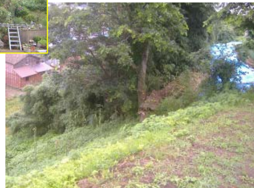
かしわぎし くじらなみ 新潟県 柏崎市 鯨波3丁目