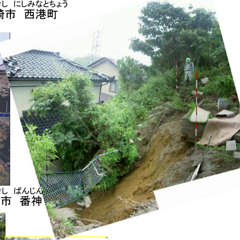
かしわぎし ばんじん 新潟県 柏崎市 番神