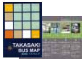
(転入者に公共交通情報を提供)