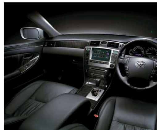
スッキリした車内