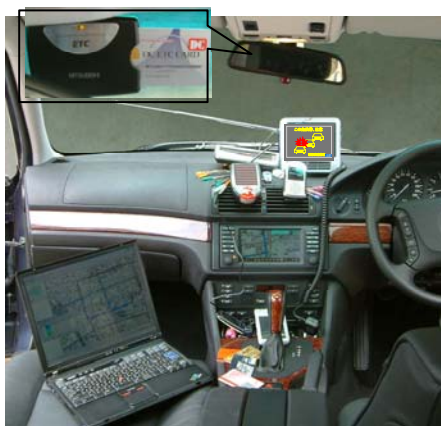
車載器であふれる車内

→ITS車載器は複数のアプリケーションに対応するため、ひとつの車載器で多様なサービスを受けることが可能。