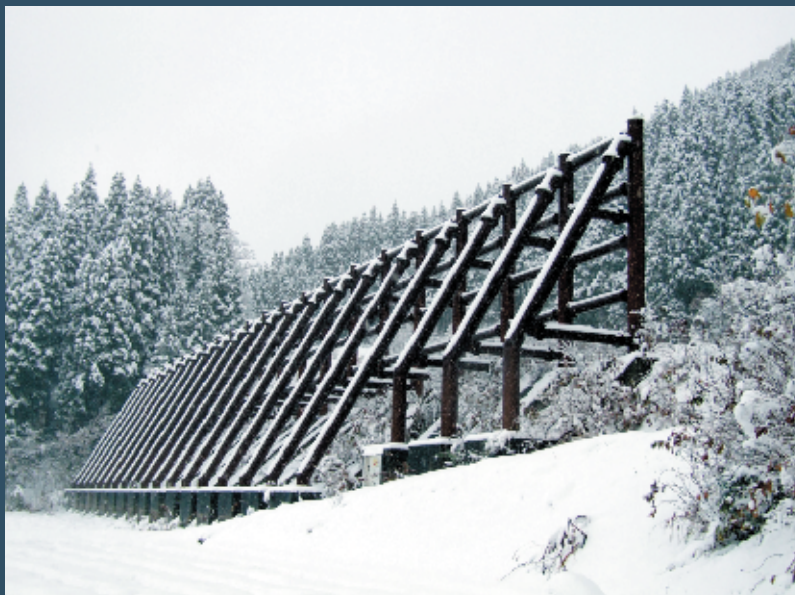
南砺市大島地区減勢工

申し込み先 「雪崩防災シンポジウム実行委員会」事務局 (富山県土木部砂防課内) TEL 076-444-3343 FAX 076-444-4420