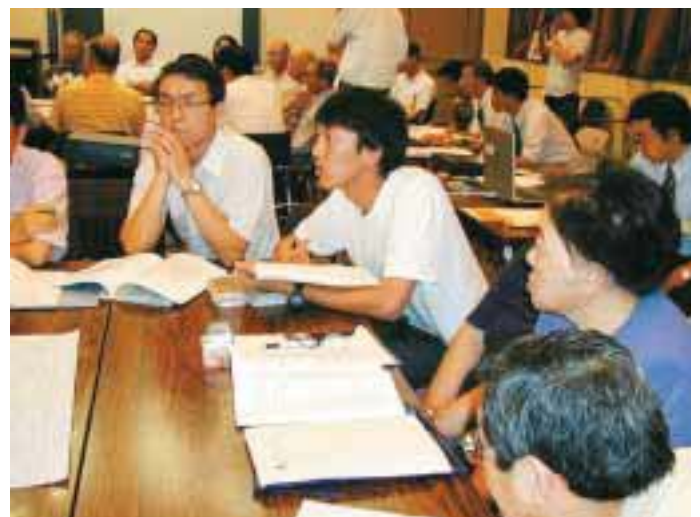
まちづくりワークショップ

こうして平成9年度、その具体策としての都市計画マスタープランづくりが始まりました。マスタープランづくりは、誰でも自由に参加できるワークショップ「これからのまちづくりを考える会」での議論を土台に、農業、商工業、建設業、不動産業、金融業など、関係団体の代表で構成される市民懇話会で煮詰め、分野ごとに都市計画審議会でもソライズするシステムで進めました。平成13年6月に、シ