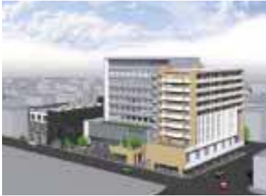
橋南第二地区施設完成予想図

第一地区の道路を挟んだ向かい側0.6haの第一種組合施行の再開発事業である。地上10階、地下1階の延床面積1万8500㎡に、地元金融機関、人形美術センター・店舗・分譲住宅（29戸）の複合ビル。当社が住宅販売および商業・業務床の賃貸を行う。住宅販売においては、「友の会」方式を採用し完売した。価格は2200万〜3000万円台で、購買者は50歳代が31%、30歳代が27%、そして40歳代が23%と続く。地震が起きた場合安全な場所に住みたい、既施行の橋南第一地区の住宅の評判が良かったためなどの理由から女性の購入が多い。また、地元金融機関が現地改革を決定したこと、人形美術センターが出来ること