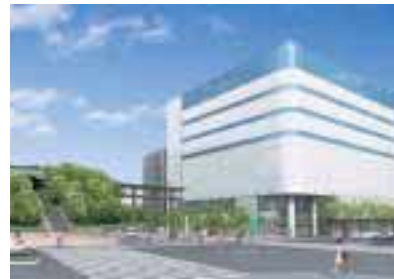
馬場通り中央地区パース

とした「宇都宮城址公園」整備が進み、市制110 周年の締めくくりとして平成19年3月にオープンし ます。それと前後して、市の中心でもある二荒山神 社下の「宇都宮馬場通り中央地区・西地区再開発事 業」も平成17年末から動き出しました。この2つの 拠点を結んで宇都宮歴史軸と位置付けていますが、こ れらの事業を契機に益々活気づくことでしょう。さ らにその中間には、かつて釜川や田川沿いで「ミュー ニティ空間として活躍した屋台が「宇都宮屋台横丁」 として、地元産大谷石や地元食材にこだわって生ま れ変わり、新たな宇都宮の情報発信基地として老若 男女に親しまれています。