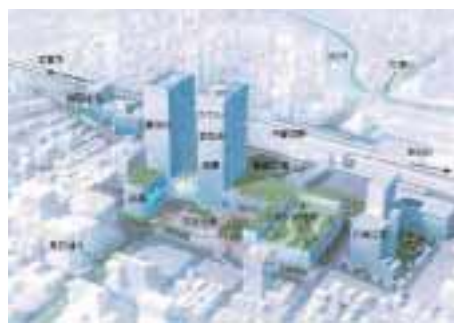
JR宇都宮駅東地区開発イメージ

もてなしを演出するた めにさまざまなまちの 仕掛けが、現在進行し ています。まちや地域 の元気度数は、どれだ け活動が展開されてい るかに比例すると思っ ます。そういう意味で は、我が宇都宮も「ま んざら捨てたものでは ない」と感じています。