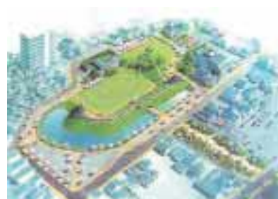
宇都宮城址公園パース