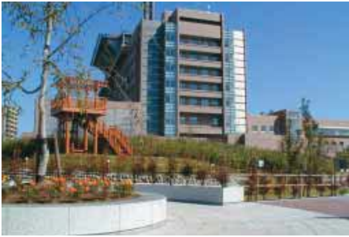
中心部に立て替えた市立病院