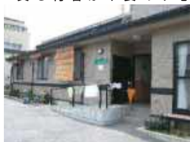
アシストホームりんご

高齢者が街なかで安心して暮らせるまちづくりを目指し、りんご並木のそばへ軽度な介護を必要とする高齢者が、医療や福祉サービスを受けながら、家庭的な雰囲気の中で暮らすことのできるケア付高齢者共同住宅を建設した。戸数は6世帯、床賃は160㎡。各個室は、約10㎡(6畳)で洗面所および収納棚がついている。サポート体制は、住み込み管理人が1名、常勤ヘルパー1名、ボランティア1名である。平成15年春オープン。