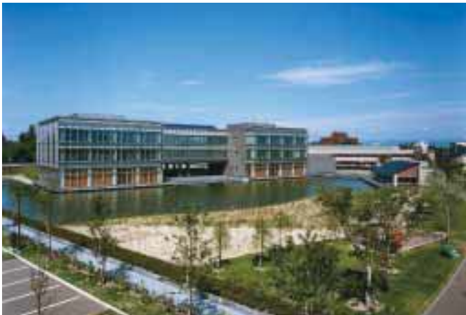
中心部に誘致したタウンキャンパス

これまでの取組みの中で、住民参加は市の財産になっていきます。ワークショップに参加した市民の多くは連絡先を市に登録し、市は計画づくりがあると登録先にダイレクトメールでお知らせします。こうして開催されるワークショップは、何度も計画づくりに参加している市民が核となった質の高い議論が展開されます。平成13年に国のモデル事業として実施した、「歩いて暮らせるまちづくり調査」ワークショップでは、ワークショップからさまざまな計画やそれを実現化するグループが生まれました。現在鶴岡市では、こうして生まれ育った市民のグループとの協働による活性化策を進めています。