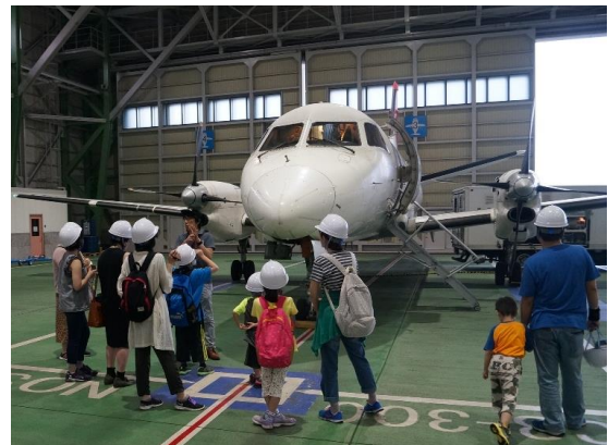
【夏休み親子ツアー（HAC格納庫見学）】