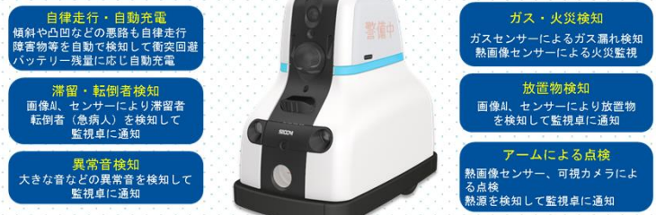
《オプション装備》 センサーアーム、ヘッドライト（威嚇・カメラ照明）、発煙装置