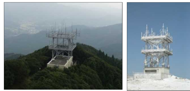
遠隔対空通信施設 (RCAG)

航空交通管制部(ACC)の管制官は、遠隔地に設置されている対空通信施設を使用することにより、航空機との音声通信が可能となる。また、全国各地に設置されている RCAGは専用通信ネットワーク等により航空交通管制部(ACC)と結ばれている。