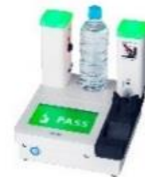
液体爆発物検査装置