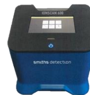
ETD(蒸散痕跡物等 利用爆発物検査装置)