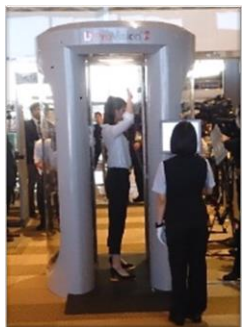
ボディスキャナー