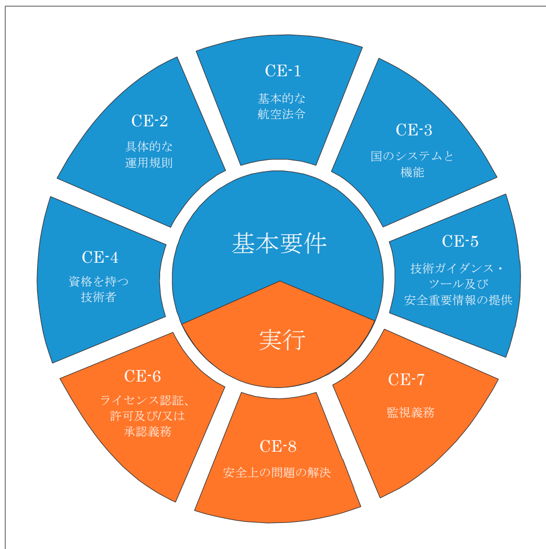
安全監督システムにおける CE

ICAOは、安全監督の8つの重要要素（CE）を定義しており、安全監督の責任を負う各国は、これらのCEを備えた安全監視活動を効果的に実施し、航空安全の確保に努めることとされている。（下図のとおり）