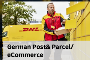
German Post & Parcel/ eCommerce