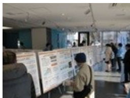
戸田公園駅周辺会場