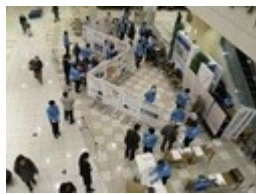
西大島駅周辺会場