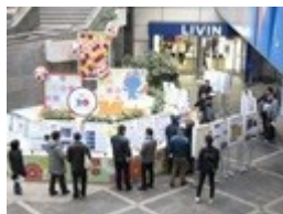
光が丘駅周辺会場