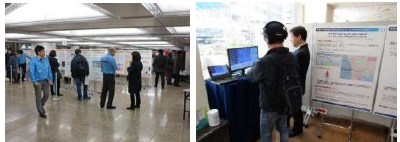
◀これまでに開催したオープンハウス型住民説明会の様子▶