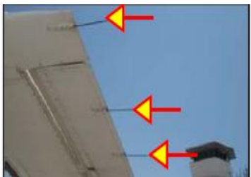
スタティックディスチャージャー (放電索)