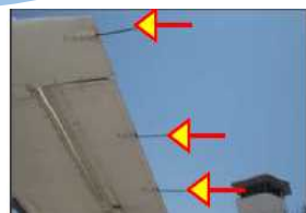
スタティックディス チャージャー (放電索)