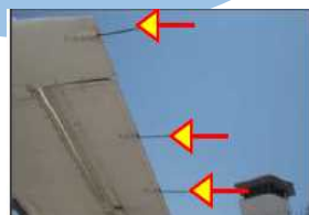
スタティックディスチャージャー(放電索)