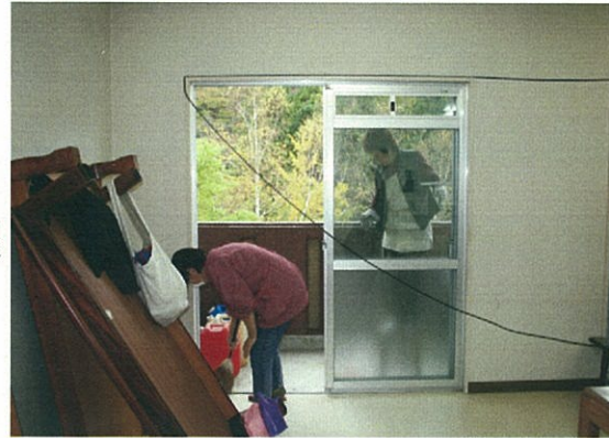
△冬季高齢者住宅開設準備

高齢化率43%の高根地域において、高齢者冬季の生活は、雪に閉ざされ衣食住にも不便をきたす生活である。そのような課題に対し、市の遊休施設を利用した冬季高齢者住宅の開設を核とした事業を展開し、高齢者の生活の質的向上を目指すとともに、ボランティア(若者)との交流、特産品開発を通じた地域コミュニティの再生を目指す。