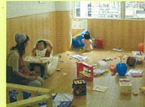
空き店舗を託児所に活用した中心市街地活性化 (高知市)