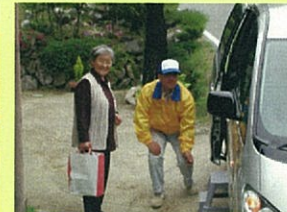
NPO等による過疎地有償運送(長野県中川村)