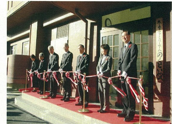
△冬季高齢者住宅「のくとい館」の開所式