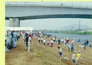
市民との協働による河川敷の清掃活動(熊本県白川)