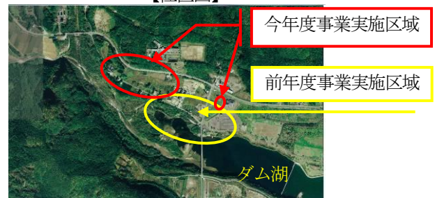
【ダム湖に沈んだ町に隣接する集落】