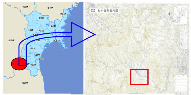
●七ヶ宿町 【位置図】 □ 関・矢立地区