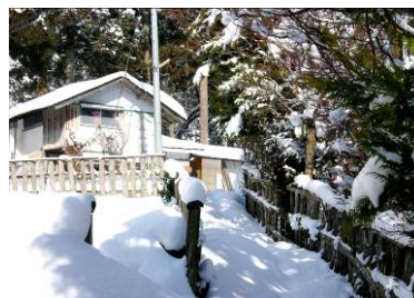
【雪に埋もれた高齢者宅】2008 年 2 月