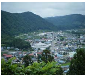
【三戸町中心街全景】