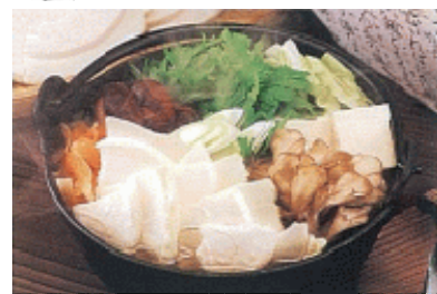
【郷土料理せんべいかやき】