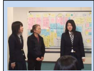
上 高校生の参加が場の雰囲気づくりに貢献 下 旅行者関係に三戸町をPRするメンバー

・千代田プラットホームやなみへいで郷土料理を食べる会での成果を、他の地域で認められ、形を変えてではあるが実施する団体が増えている。