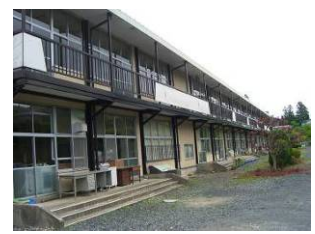
【谷内小学校の現校舎】