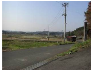
【東和東部地区は典型的な中山間地域】