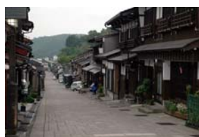
【修景整備が進む旧市街地】