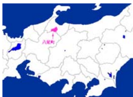
【富山市八尾町位置図】