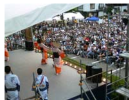
【全国的人気のある伝統芸能】