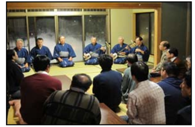
【空き店舗を活用した町屋での 伝統芸能鑑賞プログラムの様子】