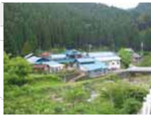
山の中に点在する宍粟市の集落（宍粟市）