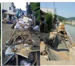
平成21年台風9号被害の様子