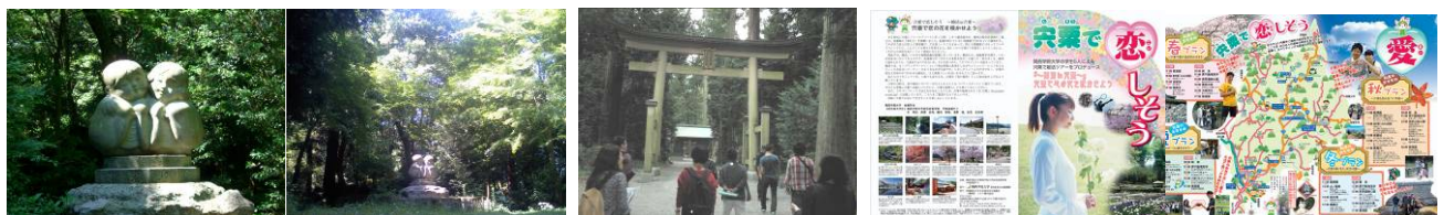
宍粟・伊和神社にて地元民（左）と学生（右）が撮影。学生は「パワースポット感」を重視。（10月14日） 学生が見て回るところ 宍粟で恋しそうプロジェクトの開始のきっかけとなった学生作成のパンフレット