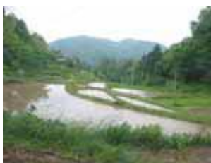
美しい景観を保つ一方で、維持が難しくなりつつある佐用町の棚田（佐用町）