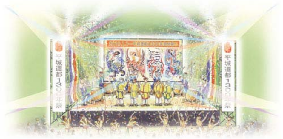
オープニングイベントイメージ図

詳細は「平城遷都1300年祭」HP http://www.1300.jp/ (新しいウィンドウで表示) をご覧ください。