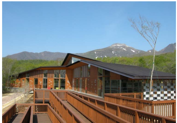
フィールドセンター