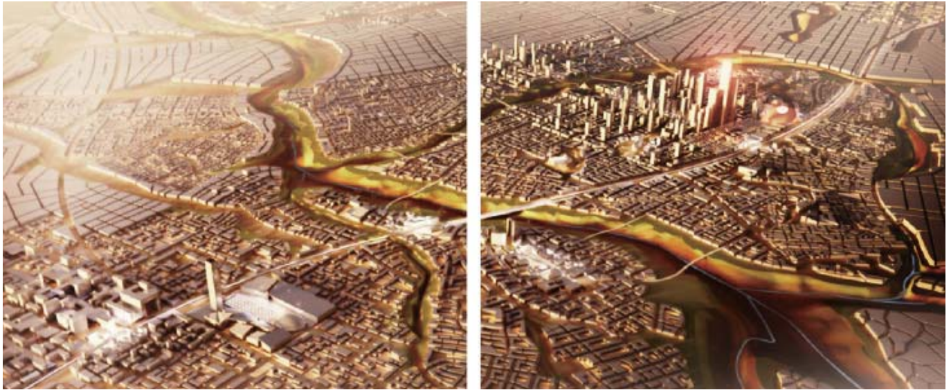
エジプトの新首都の想像図

資金の目処がつけば現首都の大規模開発も実施されるのではないのでしょうか。カイロ市への思い入れもあるでしょうし、カイロ市周辺にベッドタウンが建設され成功した事例もあります。そのことから、新首都を建設する能力はあると考えています。