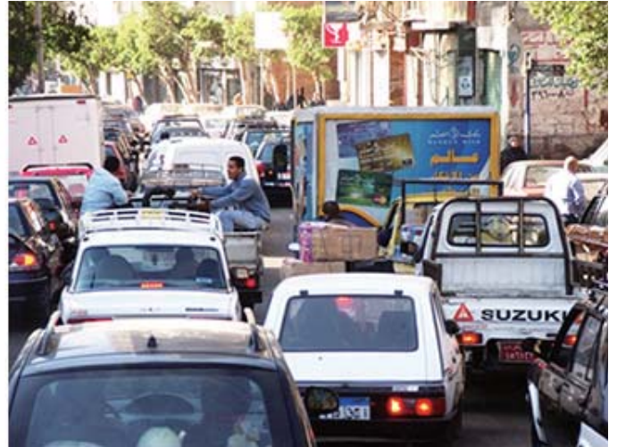
カイロの混雑状況