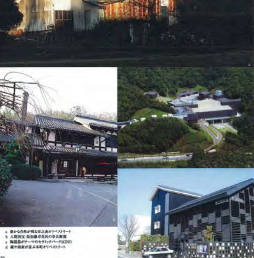
1 美濃焼の産地多治見市 2 市之倉オリベストリート 3 市之倉さかづき美術館 4 幸兵衛窯 5 岐阜県陶芸資料館 6 セラミックパークMINO 7 本町オリベストリート 8 虎渡山水保寺 9 神宮会多治見修道院

何処まで全国、いや世界にまで知られた美濃焼の産地として自負する多治見市。なかでも多治見は、美濃焼の歴史を物語る陶都の歴史を今も色濃く残している。美濃焼の歴史を物語る陶都の歴史を今も色濃く残している。