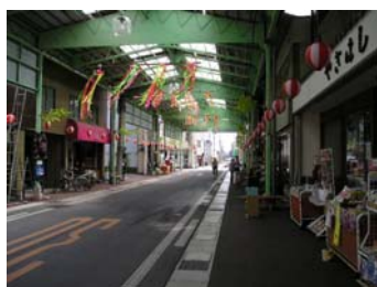
(水木しげるロード)

外国人対応として観光協会がハンゲル、繁体字、簡体字のホームページを開設。境港市が英語、ハンゲル、ロシア語のパフレットを作成している。