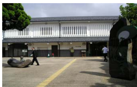
(水木しげる記念館)