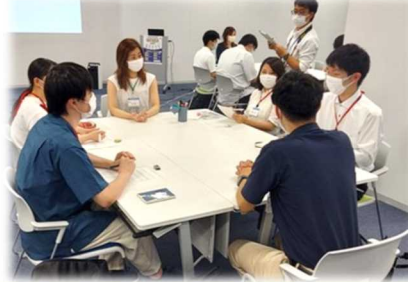
U・I ターン者との意見交換会