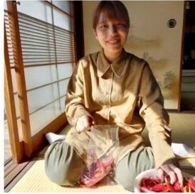
大4の学生さんが来島(秋)