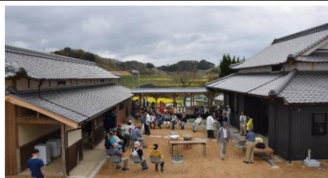
大学生滞在施設「ついでほん」