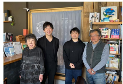
ミーツを訪ねた町民と記念撮影

地域住民が抱える不安や課題は千差万別で、一過性ではない、今後も需要が高まる重要なテーマととらえています。また、活動を続けるためには、依頼者のニーズに柔軟に対応できるパートナー(協力者)の確保が課題です。困りごとのマッチング率は月平均9割以上で、行政の手の行き届かない様々な困りごとに対して、助け合いによる解決ができていますが、現在、登録していただいている協力者数は約60人で、時間の制約などから柔軟な機動力という意味ではまだ未完了です。このため、協力者を増やすことが課題の一つです。今後は、説明会やSNSなどを通じて事業をPRしながら協力者の拡大を図っていきます。