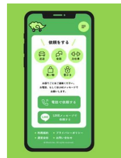
ミーツ公式LINEアプリ