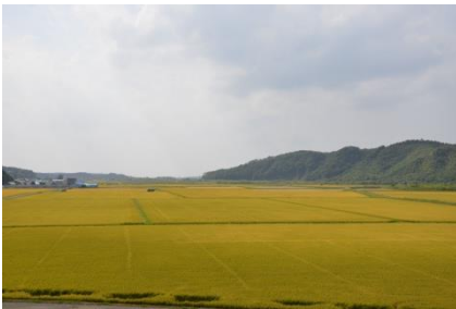
黄金色に輝く田園

平成30年北海道胆振東部地震を乗り越えて、本町の将来像「あつまる つながる まとまる 大いなる田園のまちあつま」の実現に向け新しいまちづくりを進めています。