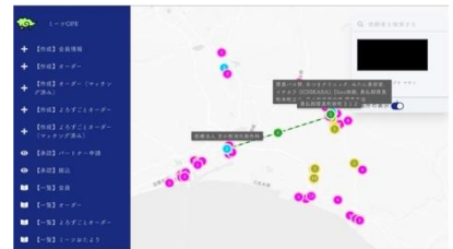
利用結果データ※一部抜粋

サービスを提供するにあたり、最も意識した点はデジタルとアナログの融合です。素晴らしいサービスを作っても、誰にも利用されないアプリを多数見てきており、現地で利用者のニーズを、解像度を高めて把握するために必要な手段はなんなのかを徹底的に考えながら実装しました。また、ミーツの世界観を創るうえで若年層や移住者の存在も重視しました。メイン利用者となる高齢層を支えるためには、協力者となる若年層の取り込みが不可欠で、そのためにはサービスの「アプリ化」が必要と考えました。デジタルの知識・技術に秀でた人材に、積極的にアプローチしてCTOとして採用しました。サービスの利用が進めば進むほど、「誰が」「どこにいて」「どのようなことに困っているか」が、アプリ内にデータ蓄積されていく仕組みを構築しました。