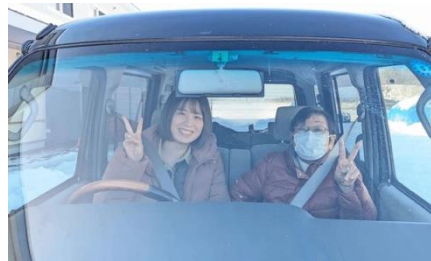
ミーツでの送迎場面

高齢化・過疎化していく地方では、交通インフラが衰退していくなかで、買い物・通院などの人々の移動手段は否応なく必要になると考え、「モビリティ事業へのトライ」をテーマに、最新のIT技術を活用し、自動車やバスなど最低限のリソースを最大限に生かすことで問題解決に結び付けよう取り組みました。時間が許す限り直接出向くなど地域住民との関係を築き、住民による共助サービスを提供しながら、住民や地域の活性化を生み出そうと考えました。取り組みを進める中で、住民の困りごとは、移動だけでなく、それ以外にも力仕事や雪かき、スマホの使い方を教えて欲しいなどができなくなっていることがわかり、単なるMaaS「Mobility as a Service」とは異なり、あえて「まちづくり as a Service」と銘打ち、発想を広げることにしました。