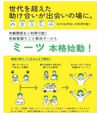
本格始動したミーツ

本格的に事業をスタートしてから、利用者の評判は口コミで広がり、令和6年9月末現在の登録利用者数は180人強(うち65歳以上は83人)で、厚真町の総人口(4,246人)の4.2%、65歳以上(1,622人)の5.1%にあたります。また、1カ月平均約30件の依頼が寄せられるようになりました。