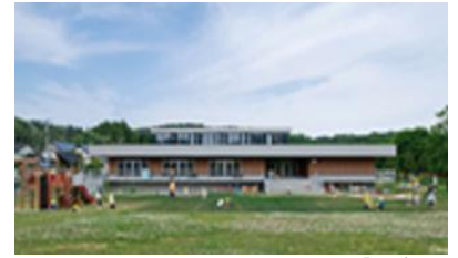
こどもたちを受け入れる認定こども園「はぜる」

「地域を支える人材の確保・育成」 こどもまんなかまちづくり等の こども・子育て支援