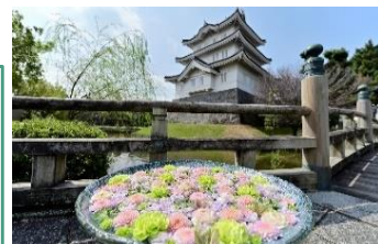
忍城(おしじょう)の花手水