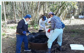
放置竹林の伐採竹から竹炭を作る 障害者支援施設の皆さん