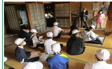
「総合学習」の一環として、小学生が空き家の掃除後に地域学習