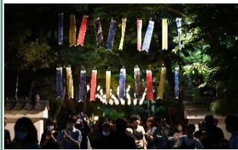
毎月一夜限定のライトアップ「希望の光」