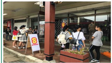
若者でにぎわうノ木戸商店街