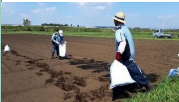
放置竹林の竹から作った土壌改良材を サツマイモ畑に。できたイモは干し芋に