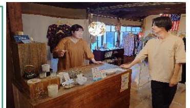
TREE店内で開業した古着屋