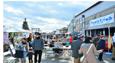
倉庫や岸壁を会場にしたイベント