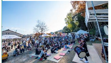
倒伏した大杉で作った楽器で演奏会