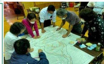
中学生以上住民アンケートをもとに地図上で地域の計画づくり