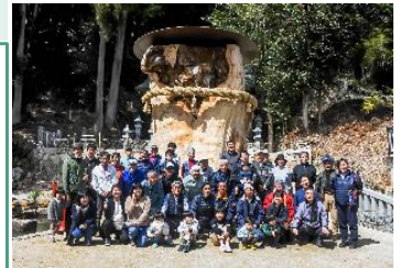
倒伏した大杉を町の新たなシンボルに