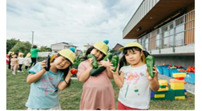
こども園菜園でのこどもたちの収穫体験