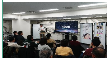
東京で起業セミナー開催