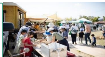
「人が繋がる」イベントの実施

▶「 のきさき 」プロジェクト=既存のお店の時間外や定休日にお試しで店舗を貸り開業のハードルを下げる。これにより「どんな町か?」「客層は?」などを掴んでもらう