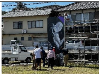
会場設営は住民ボランティアも参加