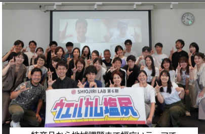
特産品から地域課題まで幅広いテーマで地域資源の磨き上げや活用に取り組むメンバー