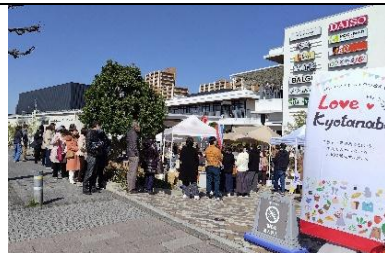
新しい住民が多い市北部の商業施設で年4回マルシェを開催