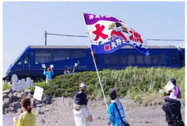
海岸で地域の皆さんと一緒に大漁旗で列車を歓迎