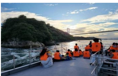
せとうちの名勝を間近で体感できる爽快ミニクルーズも企画