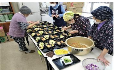
お弁当昼食会で振る舞うお弁当の準備風景