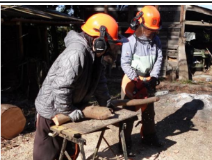
里山や耕作放棄地を再生するための機器の技術を学ぶ 技能講習会