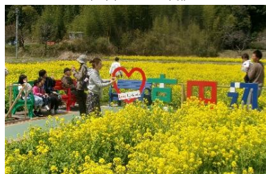
観光協会とタイアップした「菜の花回廊」