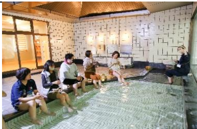
新温泉×ワークの発想から生まれた「湯治ワーケーション」での足湯