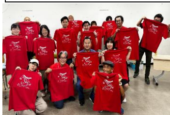
お揃いの真っ赤なユニホームの芸術祭実行委員