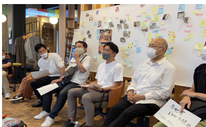
フィールドワーク中の対話の様子