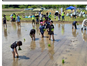
百年続く田んぼを作ろう！「百ねたんぼ」