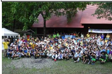
毎年200人近くの親子が集うキャンプフェスティバル