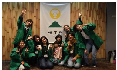
「快く生きる」を体現する地域共創型マルシェ「鹿の湯 酒まつり」