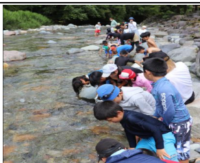
カジカ稚魚放流による保護活動