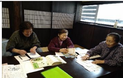
「まめ」新聞有志会3人が新聞記事について話し合う様子