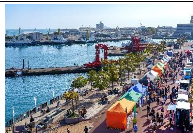
海と港を楽しむ交流の場、せとうちみなとマルシェ