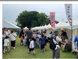
収穫祭と地元の伊奈氏研究発表の場「イナフェスタ」

※各事例の注目点・評価点や審査の総評は、下のQRコードか、検索窓から【地域づくり表彰】