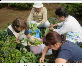
かつての地元の名物だった赤山漬を還元し染物や工芸品に