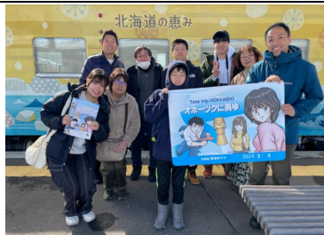
コロボ列車の特製の乗車ボードで記念撮影