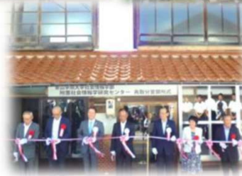
交流拠点（カフェ・ギャラリー、 飲食店、青山学院大分室）