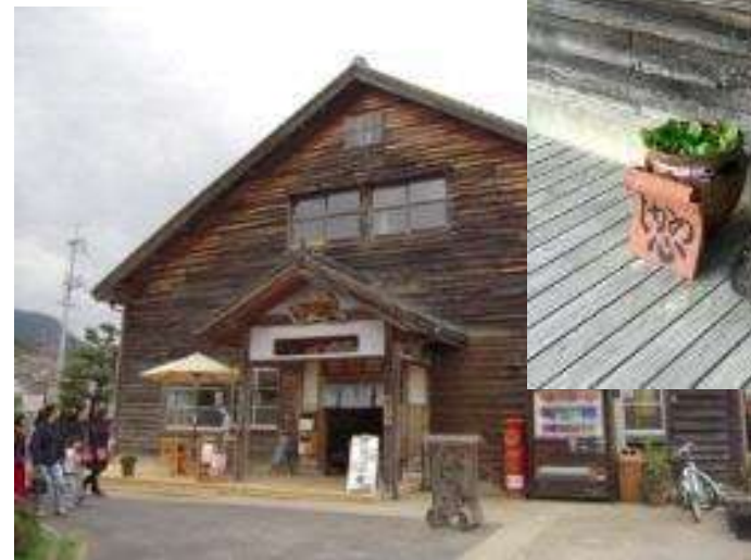
カフェ&ギャラリー「しかの心」