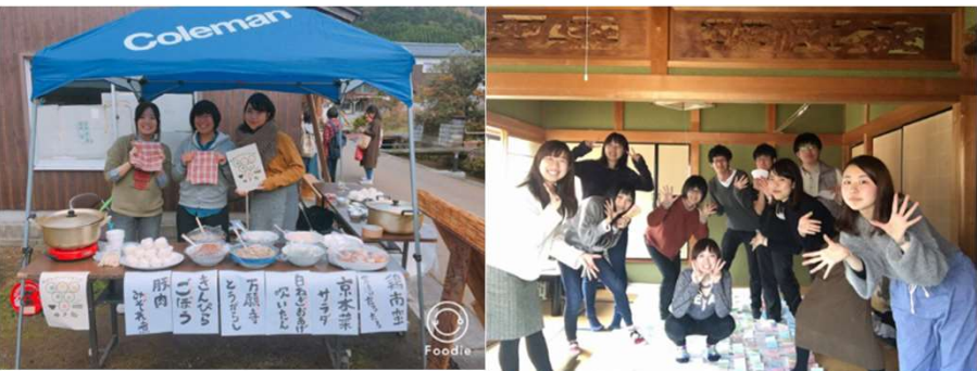
おかえり！週末住人s