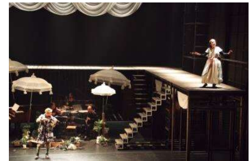
鳥の劇場・鳥の演劇祭