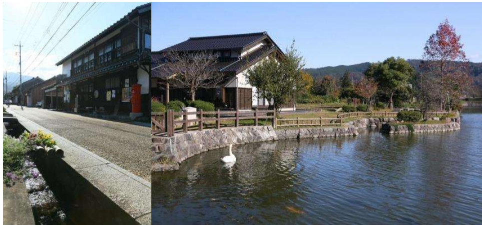
鳥取市鹿野地区のまちなみ