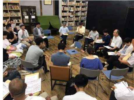
フォーラムの開催