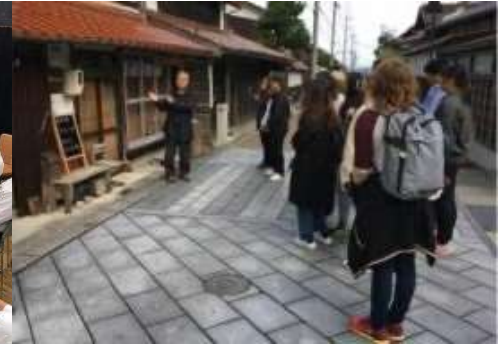
大阪国際大学 地域学習