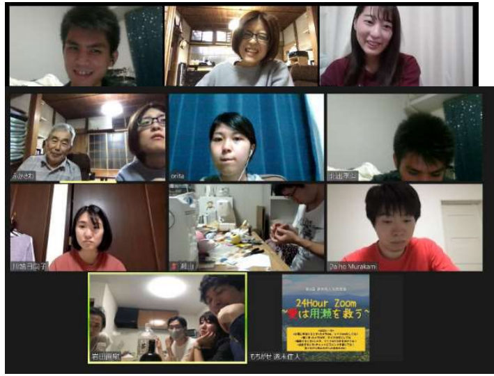
オンライン同窓会