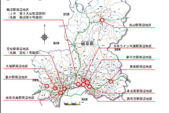
表 推進費施行箇所一覧