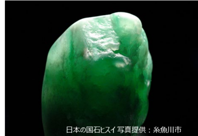
日本の国石ヒスイ