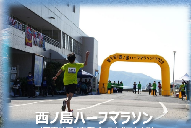
西ノ島ハーフマラソン