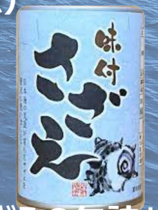
町の特産品「さざえの缶詰」