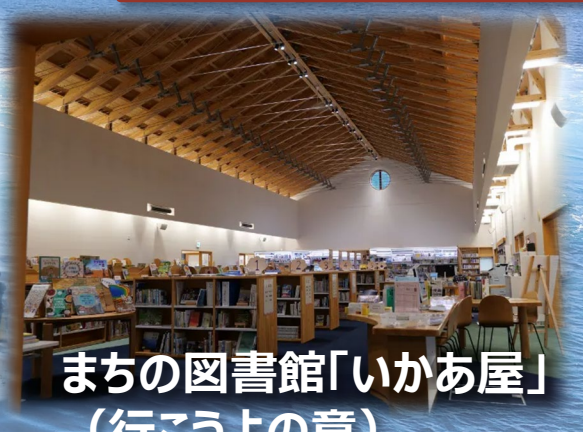
まちの図書館「いかあ屋」 (行こうよの意)