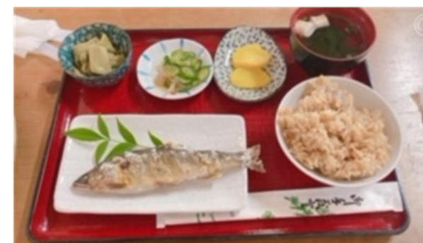
↑ 味工房じねんで食べた鮎の塩焼き定食