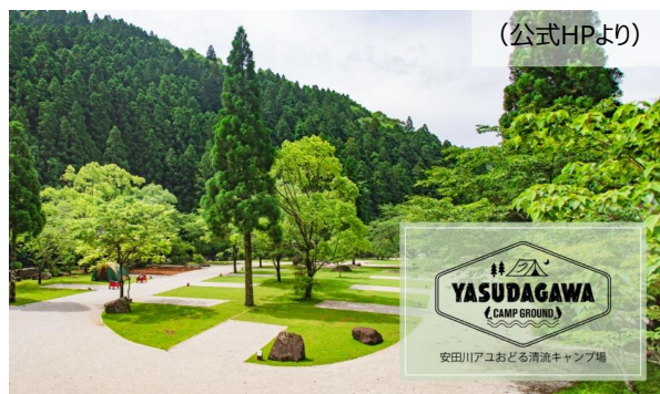
↑ 安田川アユおどる清流キャンプ場