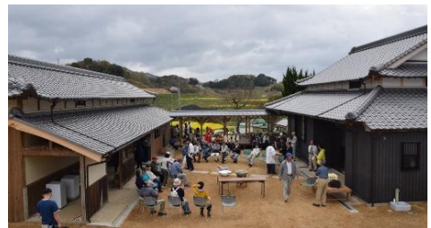
大学生滞在施設「ついどはん」