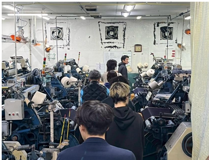
※参考：令和7年度就業体験実施風景

デニムやワークウェアなど福山市の繊維産業を体験し学ぶことができる「就業体験プログラム」を実施！！