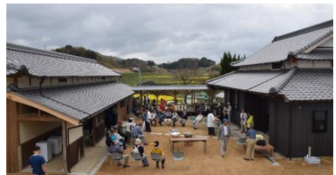
大学生滞在施設「ついどはん」