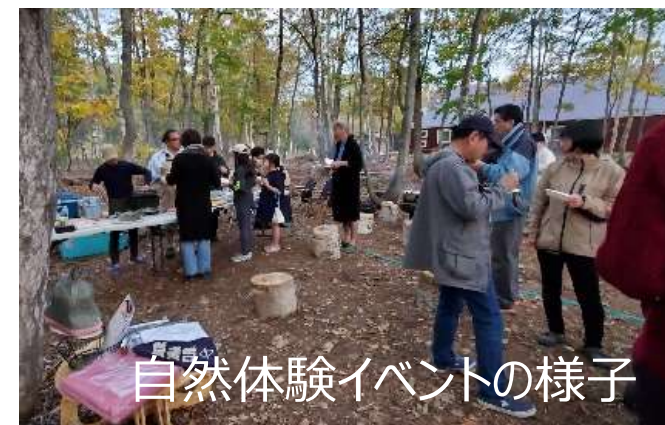
自然体験イベントの様子